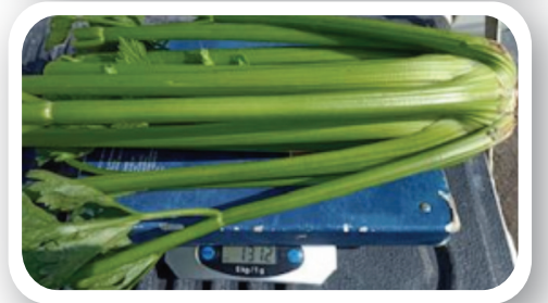
Peso con tratamiento PTI